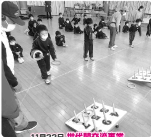
11月22日 世代間交流事業

冬季期間の健康づくりのために取り組んでいるニュースポーツをまきば保育園の年長クラスの子どもたちに教えました。