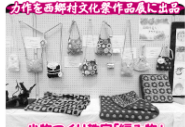
力作を西郷村文化祭作品展に出品