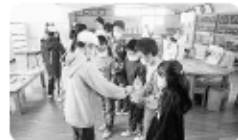
「米小学校」募金活動の様子