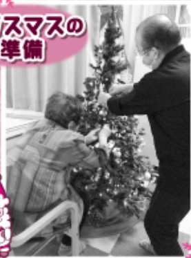
クリスマスの準備