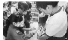
「小田倉小学校」募金活動の様子