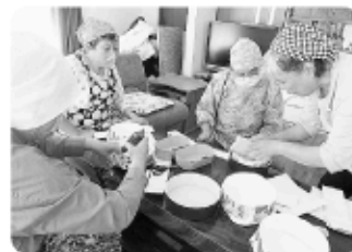
いきいきサロン「コロ駅」