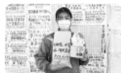
「西郷第二中学校」募金活動の様子

*その他 西郷村民生児童委員協議会、西郷村役場職員、西郷村社会福祉協議会職員、募金箱設置(西郷村文化センター、西郷村高齢者生活支援センター)