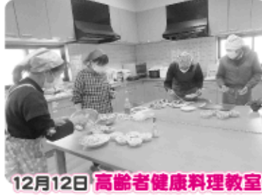
12月12日 高齢者健康料理教室