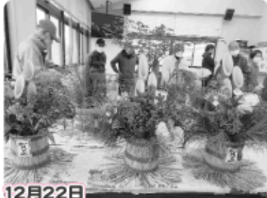
12月22日 小物づくり教室「ミニ門松づくり」

老人クラブ連合会では、寒さで閉じこもりがちな冬季にさまざまな事業を開催しています。