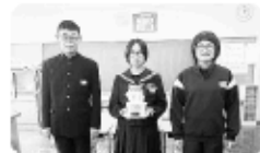
「川谷中学校」募金活動の様子