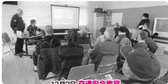
12月7日 交通安全教室