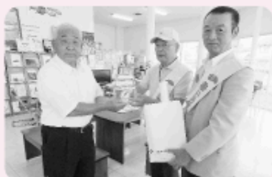
ホンダカーズ白河西 白河インター店 様

西郷村民生児童委員の代表2名が村内事業所へ、赤い羽根共同募金運動への協力依頼に伺いました。