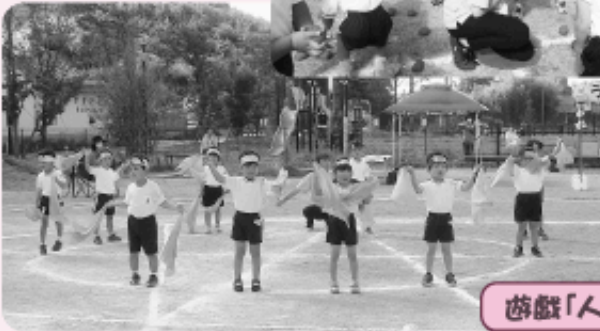
遊戯「人気者で行こう」