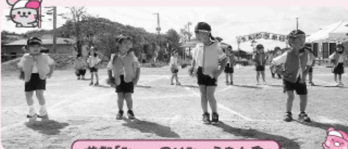
遊戯「ひよっこいひょうたん島」