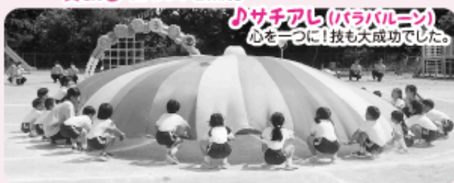
♪ サチアし(パラバルーン) 心を一つに！技も大成功でした。