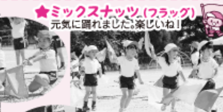
★ ミックスナッツ(フラッグ) 元気に踊れました！楽しいね！