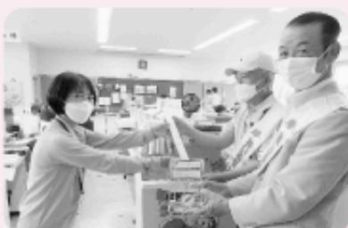
社会福祉法人 福島県社会福祉事業団 様