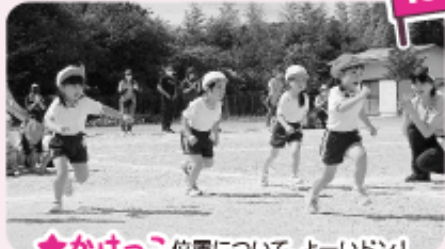
★ かけっこ 位置について、よーいドン！