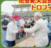
花安紀夫会長より優勝者へトロフィーの授与