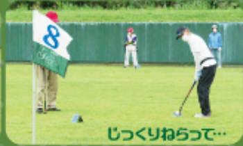
じっくりわらって...