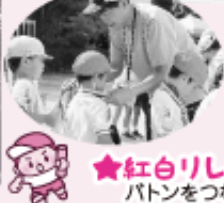
★ 紅白リレー バトンをつないで走れ、走れ！