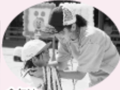
今年、紅白引き分けでした！ピカピカのメダルをもらったよ。