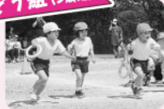
★ 紅白リレー 保育園最後のリレー、全力で頑張りました。