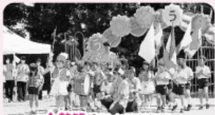
★ 技笛 「かわいい音楽隊」