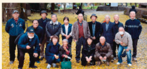
親睦旅行 喜多方・柳津方面 (令和3年11月)