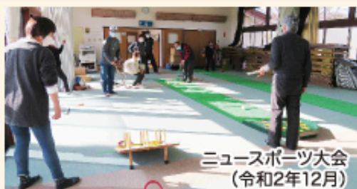
ニュースポーツ大会 (令和2年12月)