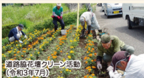
道路脇花壇クリーン活動 (令和3年7月)