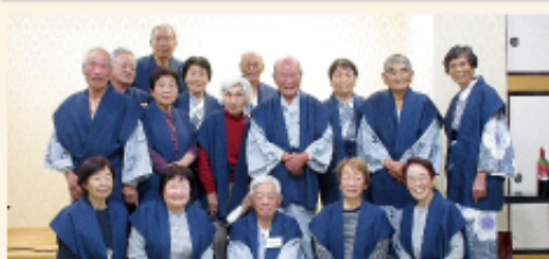
大塩裏磐梯温泉親睦旅行 (令和3年11月)