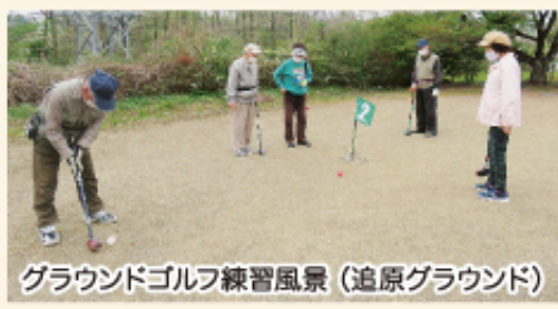
グラウンドゴルフ練習風景 (追原グラウンド)

老人クラブ活動には、たくさんの笑顔と新しい出会い、そして楽しい活動がいっぱいです。皆様の入会をお待ちしております。