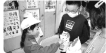
「小田倉小学校」募金活動の様子