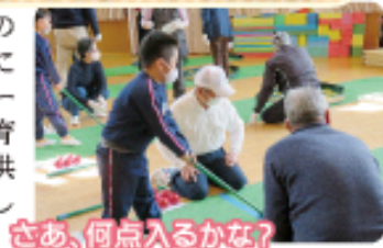
さあ、何点入るかな？

11月16日、冬期間の健康づくりのために取り組んでいるニュースポーツをまきば保育園の年長クラスの子供たちに教え、一緒に楽しみました。