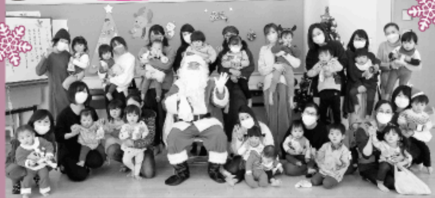
サマサンとハイポーズ！

今年もつどいの広場にサンタさんがやってきました！驚いて泣いてしまう子もいましたが、1人ひとりプレゼントをもらい楽しいクリスマス会になりました。