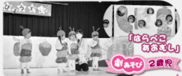
「はらぺこあおむし」