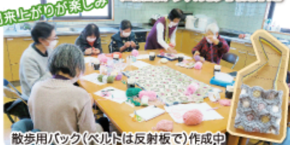
散歩用バック(ベルトは反射板で)作成中