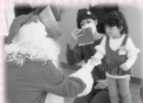
プレゼントありがとう！