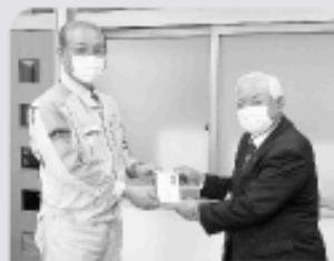
信越化学労働組合白河支部様(左)、花安会長(右)