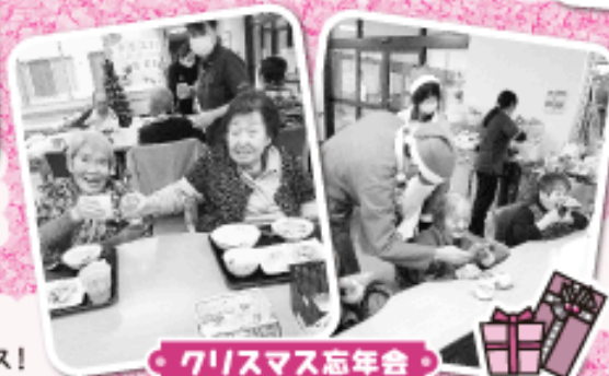
クリスマス忘年会