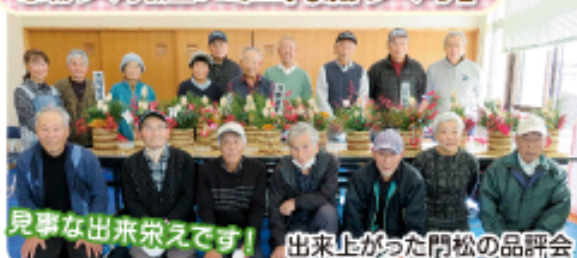
見事な出来栄です！