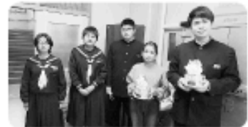
「川谷小学校」募金活動の様子