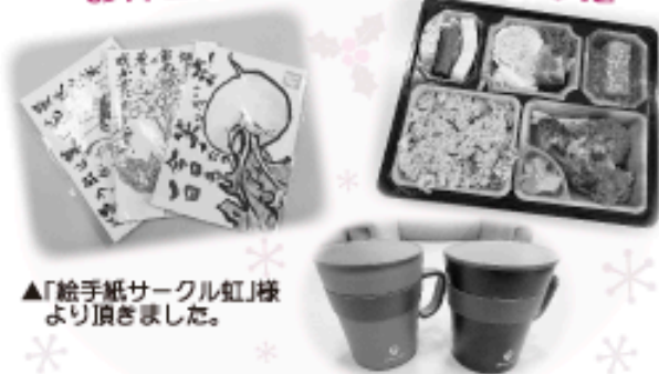
▲「絵手紙サークル虹」様より頂きました。