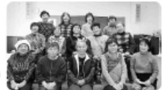
「大平いきいきサロン」