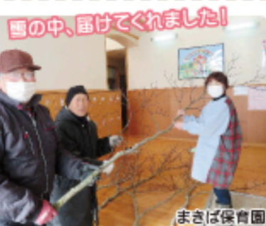
雪の中、届けてくれました！