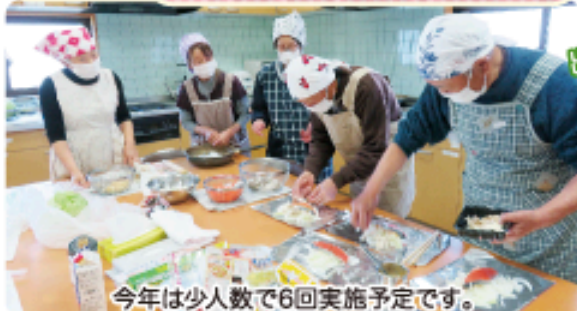
今年は少人数で6回実施予定です。