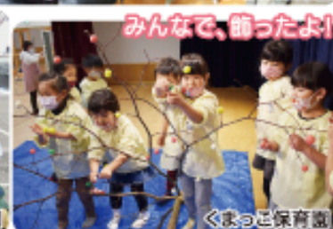
みんなで、飾ったよ！