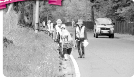
5月3日 道路のごみ拾い