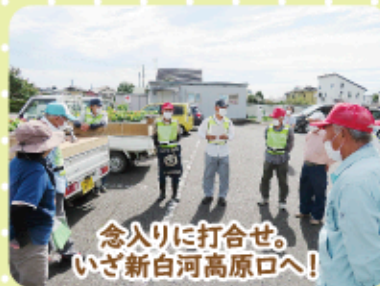
念入りに打合せ。いざ新白河高原口へ!