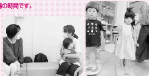
助産師さん相談会