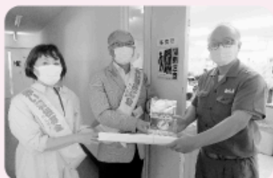
三菱製紙(株) 白河事業所 様

西郷村民生児童委員の代表2名が 村内の事業所へ、赤い羽根共同募金運動への協力依頼に伺いました。