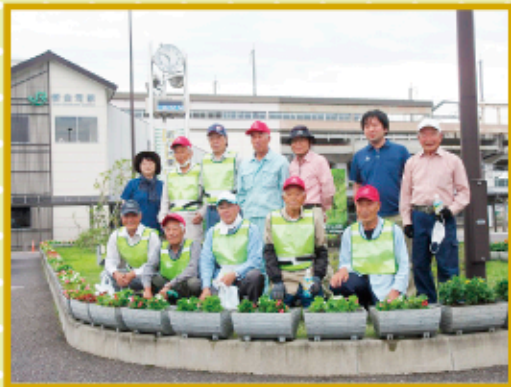
今年も頑張ります。花部会一同