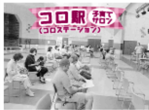
コロヱツ (コロステーション)