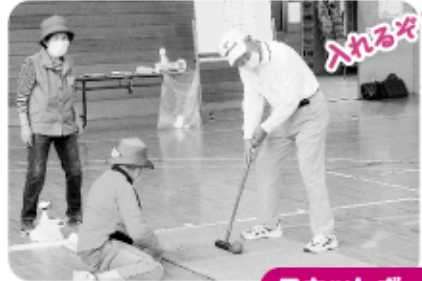
シャッフルボール