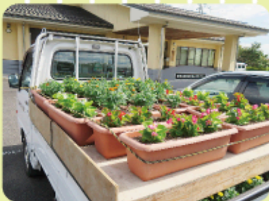
花育成協力者に育てて頂いたマリーゴールド・ペコニアの花