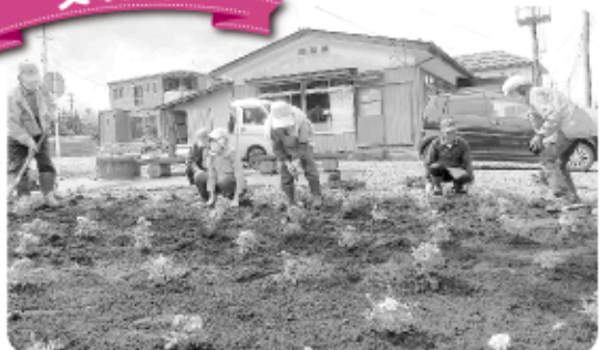
7月5日 大平公民館周辺