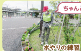
ちゃんと水、出ました~