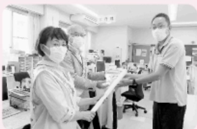
社会福祉法人 福島県社会福祉事業団 様