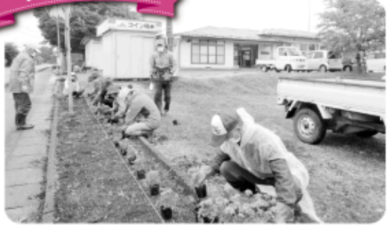
7月4日 一ノ又多目的研修施設及び周辺歩道