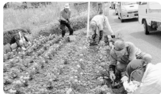
7月29日 道路脇花壇の除草