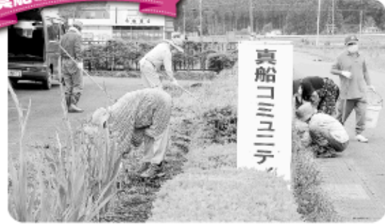
7月3日 真船コミュニティセンター及び周辺