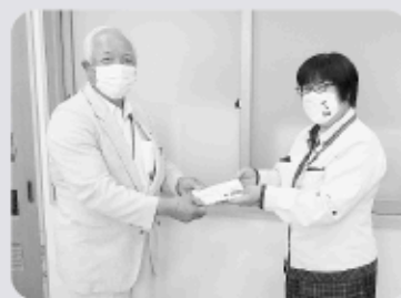
郡山ヤクルト販売株式会社様