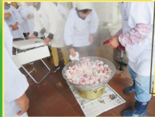
炊出し訓練 (ハイゼックス調理)