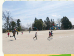
きりん組 マラソン