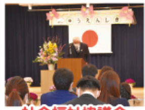
社会福祉協議会 副会長挨拶