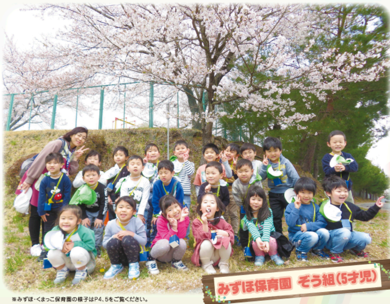
※みずほ・くまっこ保育園の様子はP4、5をご覧ください。