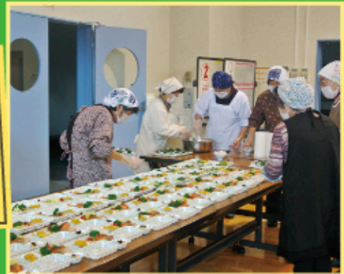
配食サービス調理