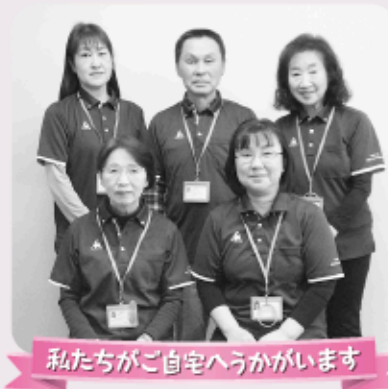
私たちがご自宅へうかがいます

西郷村個人情報保護条例第9条(委託に伴う措置等)により守秘義務が徹底されております。