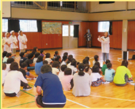
川谷小学校 炊出し訓練

日本赤十字社がはじめて救護を行った西南戦争以降の、さまざまな災害や事故の現場に救護班が派遣されています。こうした活動は、ご寄付や活動資金によって支えられています。 いのちを救う(人道)活動を続けるために活動資金のご協力をお願いいたします。