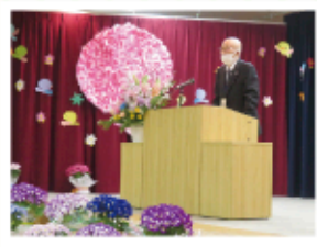
社会福祉協議会会長挨拶