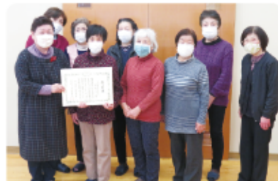
団体の部受賞 アルミ缶リサイクルグループ「たんぽぽ」様