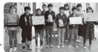
「米小学校」募金活動の様子