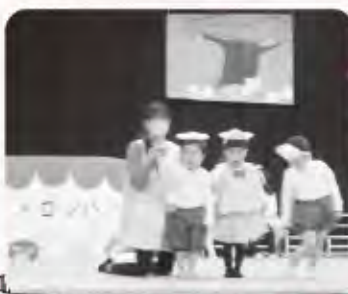
りす組(2歳児) 遊戯「3つのメロンパン」