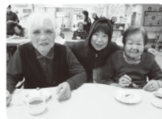
デイサービスセンター「ふれあいの家」クリスマス会の様子