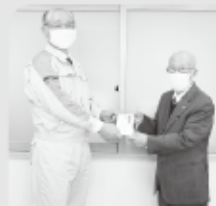
信越化学労働組合 白河支部様(左)