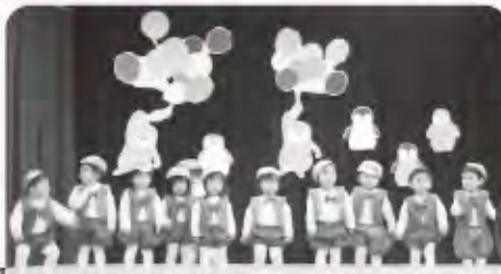
ペンギん組(1歳児) 遊戯「ペンギンサンバ」

1年間の集大成でもある発表会を、開催しました。子どもたちはドキドキしながらも堂々と発表する事が出来ました。