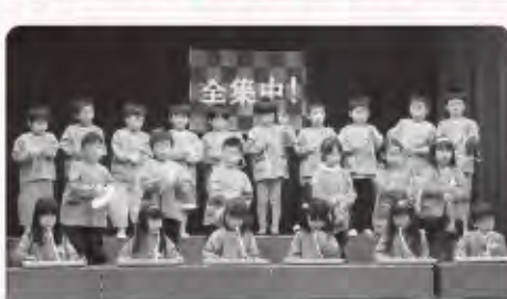
ぞう組(5歳児) 合奏「紅蓮華」「ドラゴンクエスト」 劇「リトルマーメイド」