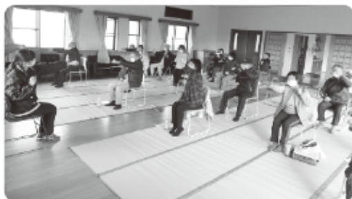
講師：地域包括支援センター職員

11月5日、真船あじさいクラブは真船コミュニティセンターで19名が参加し健康教室を開催。地域の方々にも呼びかけて地域交流の機会になりました。