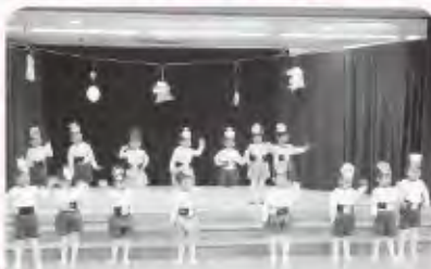
ぼんだ組(3歳児) 遊戯「無責任ヒーロー」「ステキな日曜日」 劇「三匹のやぎのがらがらどん」