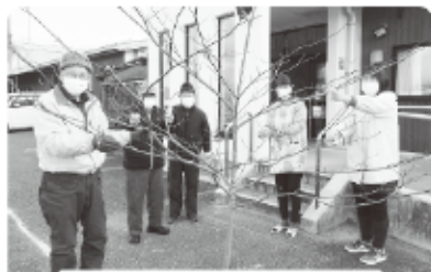
りっぱなミズキの木ですネ！ —みずほ保育園—

毎年恒例となっております、老人クラブと保育園の子どもたちとの世代交流事業ですが、今年はコロナ感染予防のため交流は中止しミズキの木を届けました。