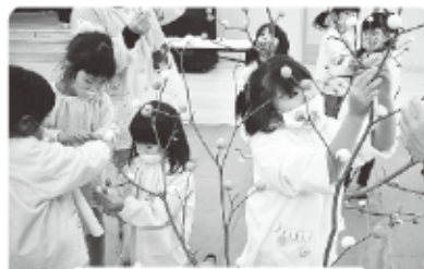
きれいに飾りました！ —くまっこ保育園—