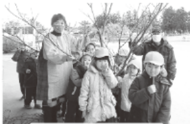
おじいちゃんありがとう —まさば保育園—