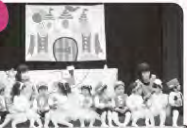
こあら組(1歳児) 遊戯「おもちゃのチャチャチャ」