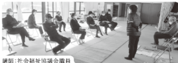
講師：社会福祉協議会職員

12月13日、一ノ又つくし会は会員11名が参加し、一ノ又多目的研修施設で健康教室とニュースポーツ大会を開催しました。コロナ禍の中感染予防対策をしながら楽しい交流の機会となりました。