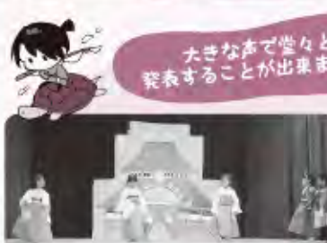
さりん組(4歳児) 劇「うらしま太郎」 合奏「夢をかなえてドラえもん」