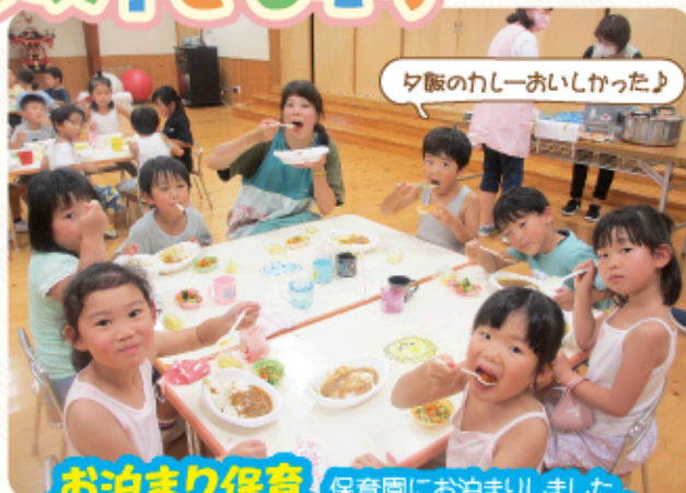
夕飯のわしーおいしかったよ