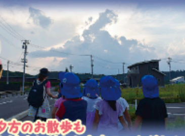
夕方のお散歩もお泊りだから出来ることだね!