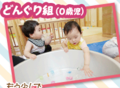
もう少しで届きそう~!