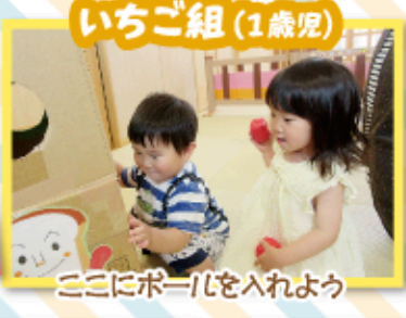
ここにボールを入れよう