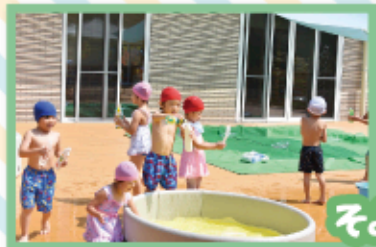
手作りおもちゃで水遊び