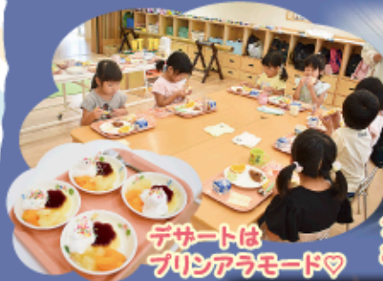
デザートはプリンアラモード♡

★ あおぞら組(5歳児)13名が、保育園にお泊りしました。楽しいことがいっぱい、お家の人と離れてのお泊りが初めてのお友だちも笑顔で過ごすことが出来ました。素敵な思い出になりました！