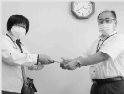
郡山ヤクルト販売株式会社 様