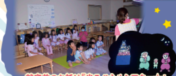
就寝前のお話は「光るパネルシアター☆」