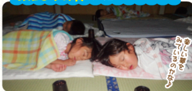
楽しい寝をみているのかなよ