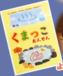
ようこそ!くまっこ温泉へ