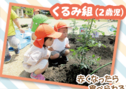
赤くなったら食べられる?