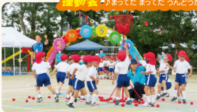
♪まてたまてたうんどうかい♪ 秋空の下で運動会が開催されました