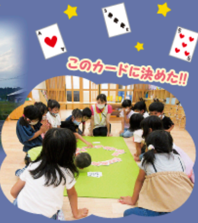
このカードに決めた!!