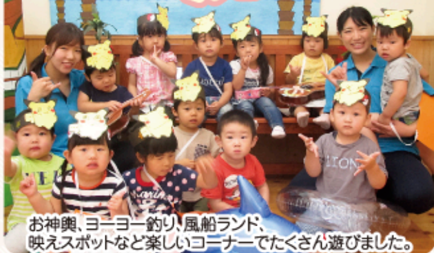
お神輿、ヨーヨー釣り、風船ランド、映えスポットなど楽しいコーナーでたくさん遊びました。