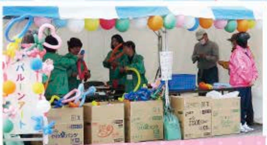
まもなく桜まつりスタート！ いまのうちにたくさん作っておかなくちゃ！

4月14日に開催された「太陽の国桜まつり」に、バルーンアートボランティアとして参加しました。ボランティアのみなさんは、昨年度本会で開催した「バルーンアートボランティア養成講座」を受講された方々で、この日のために事前打ち合わせ、役割分担などの準備を整え当日を迎えました。最初は緊張した様子のボランティアさんも、予想を上回る大反響に、楽しく活動することができたようです。初めての参加でしたが、当ブースには多くの方がいらっしや、子ども達の笑顔もたくさん見られました。