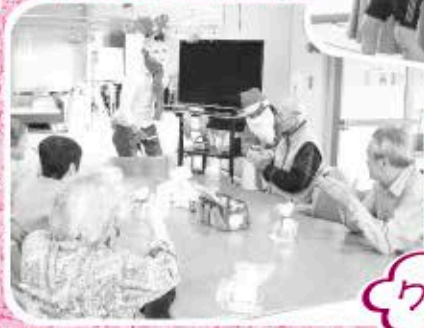
クリスマス・忘年会