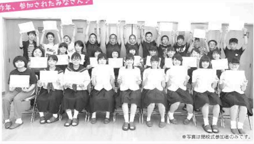
※写真は開校式参加者のみです。