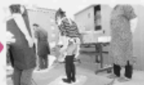
この作業でうどんのこしが決まります!!