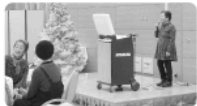
広い会場でカラオケは最高です!

令和元年12月13日、村内のひとり暮らしの高齢者の方を対象に、東京第一ホテル新白河にて「ひとり暮らし高齢者クリスマス交流会」を開催し、36名の方の参加がありました。参加者はフルコース料理に舌鼓を打ち、カラオケやくまっこ保育園児たちのかわいらしいお遊戯を楽しみました。