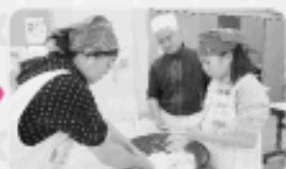
うどんをこねるのはなかなか大変です。