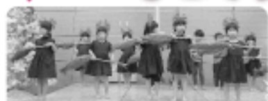
くまっこ保育園児のお遊戯「ルージュの伝言」

令和元年12月13日、村内のひとり暮らしの高齢者の方を対象に、東京第一ホテル新白河にて「ひとり暮らし高齢者クリスマス交流会」を開催し、36名の方の参加がありました。参加者はフルコース料理に舌鼓を打ち、カラオケやくまっこ保育園児たちのかわいらしいお遊戯を楽しみました。