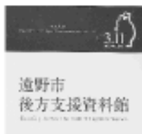
遠野市 後方支援資料館

東日本大震災時に沿岸部の後方支援拠点となった遠野市の「遠野市後方支援資料館」を訪れ、遠野市消防本部消防長からの説明に真剣に耳を傾けました。官民一体で活動した遠野市の後方支援は先端事例として注目を集めており、団員たちは貴重な教訓を得ることが出来ました。