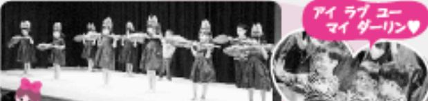
アイラブユー マイダーリン