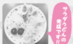
ほかにも「湯うどん」と「ざるうどん」も作りました。どれもおいしかったです。