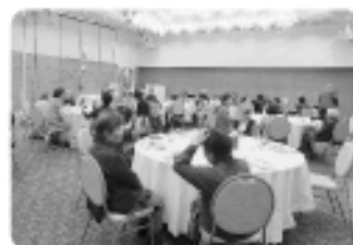
ひとり暮らし高齢者クリスマス会で会食を楽しんでいただきました。