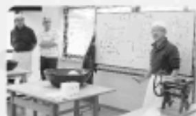
うどんを打つ前に結乃会の方から説明を受けました。

令和元年12月22日、「家族ふれあいうどん打ち教室」を開催いたしました。村内の親・子、祖父母・孫の5組11名の方が参加され、ボランティア団体「結乃会」の皆さまから丁寧にご指導いただきながら、家族で協力し合いうどんを完成させました。参加者からは、「子供の真剣な姿が見られて良かった」、「うどんを切るのが大変だった」や「家でもぜひ作りたい」など、様々な感想が寄せられました。