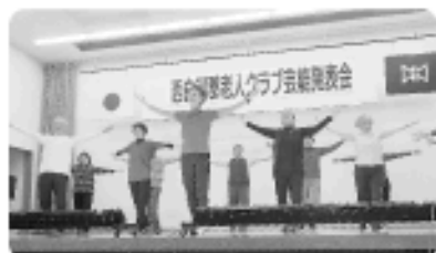
▲木よう会「ひばりエクササイズ」