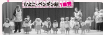
ひよこ・ペンギン組 1歳児

一年間の集大成でもある発表会が大勢の保護者・お客様を迎えて行われました。子どもたちはちょっぴり緊張しながらも堂々と発表することが出来ました。