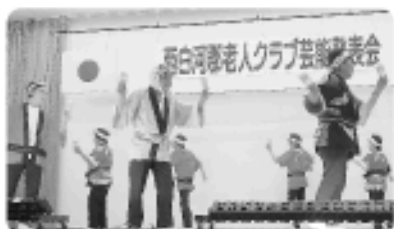
▲交友会 踊り「常磐炭坑節」