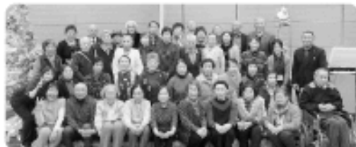
みんなで記念撮影。次回も楽しみにしていてください!