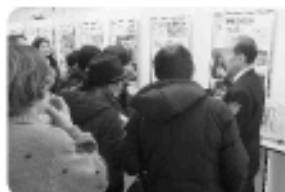
消防本部消防長が当時の様子を 教えていただきました。