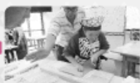
「太さをそろえて丁寧に!」