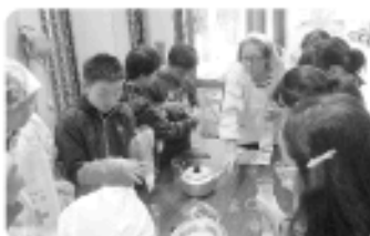
梅干などの具材もお米と一緒にハイゼックスに入れます。

出来上がったハイゼックス非常食は、団員が作った豚汁と一緒においしく試食し、炊出し訓練を無事に終了しました。