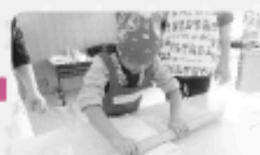
伸ばした生地を折りたたんで、また伸ばして...