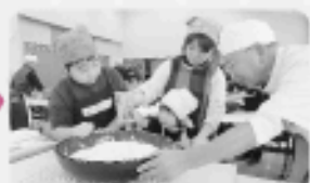
「お水は少しずつ入れてくださいね。」