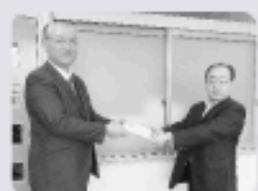
信越化学労働組合白河支部 様(左)