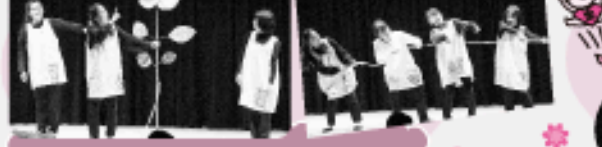
夕霧餅会にみんなで飾った「笑顔の種」から「高りがどうの花」が咲きました。