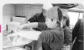
「やけどに気をつけてやさしく切きましょう。」