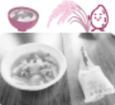
出来上がった豚汁とハイゼックス非常食。