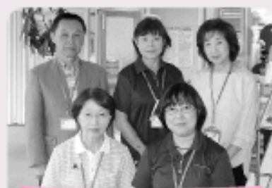
私たちがご自宅へうかがいます