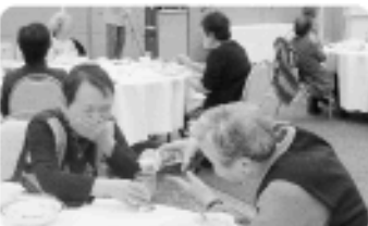
「久しぶりです。」という会話が弾みますね。