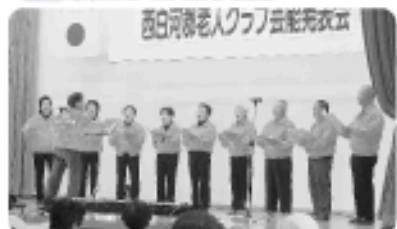
▲すみれ会「混声合唱」

令和元年11月21日、中島村生涯学習センター「輝ら里」で開催された西白河郡老人クラブ芸能発表会に参加し、西白河郡の老人クラブの皆さんと楽しい時間を過ごしました。