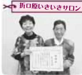
折口原いきいきサロン