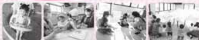
プールにおでかけ おやつ作り 季節の行事「部分」 三世代交流会

「つどいの広場ご利用時のお約束」を守り、利用するみなさんが安全に楽しく、交流していただけるようご協力をお願いします。なお、本事業の趣旨に反する場合、利用をお断りする場合もありますのでご了承ください。 「つどいの広場ご利用時のお約束」については、登録時にご説明いたします。