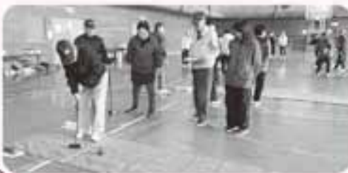
私の腕前、見てくれ!

運動する機会が減る冬場の健康づくりとして、9月~3月の間、月1回ニュースポーツ講習会を開催しました。会員以外の方の参加も受け入れ、毎回たくさんの方々で盛り上がりました。