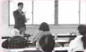
傾聴ボランティア

西郷村ボランティアセンターでは、ボランティア育成のための各種講習会を開催しています。