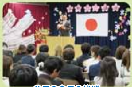
父母の会長の挨拶