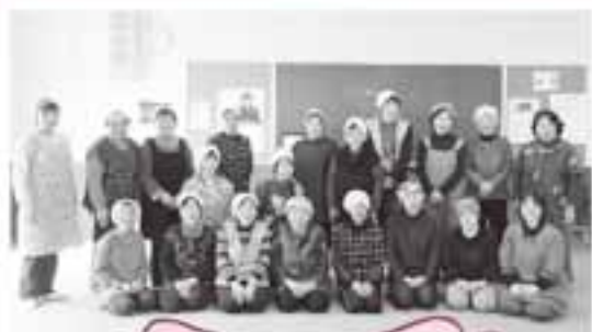
大平いきいきサロン