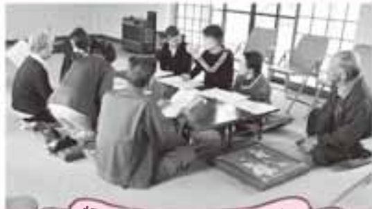
折口原住宅いきいきサロン

いざという時に頼りになる人や精神的な支えになる人がいて、安心して暮らせることは大切な事です。