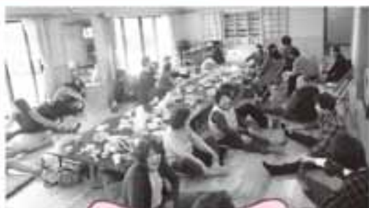
熊倉いきいきサロン