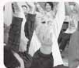
わっはっはっはー

高齢者生活支援センターにおいて健康教室「笑いヨガ」を開催しました。みんなでたくさん笑って体を動かし、頭の体操も行って楽しく過ごしました。