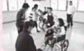
キッズボランティア