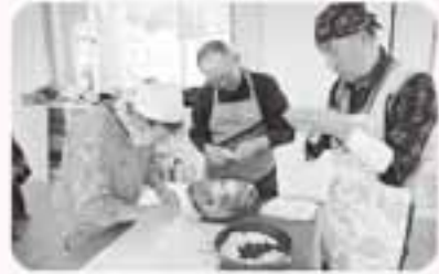
うーん、おいしいな!