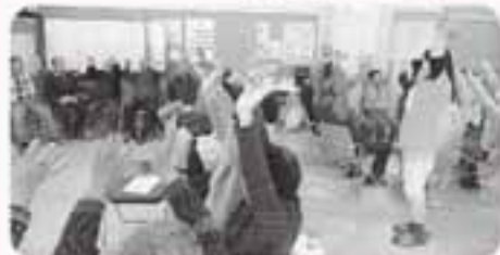
笑うことは健康の源です