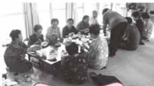
上新田いきいきサロン