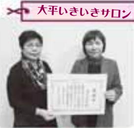
大平いきいきサロン

ボランティアフェスティバルは、今年で20回目を迎えました。県内の20年間のボランティア活動について歴史を振り返るとともに、ボランティアのさらなる可能性を見出す式となりました。