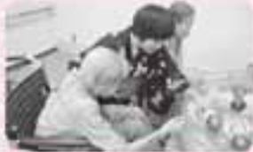
サマーショートボランティア