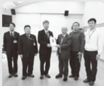
(左3名) 福島県南部郵便局長会の皆様