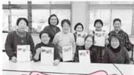
折口原いきいきサロン