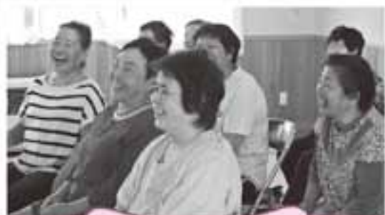
上羽太いきいきサロン