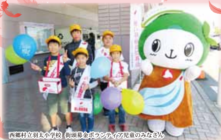
西郷村立羽太小学校 街頭募金ボランティア児童のみなさん