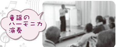
童謡のハーモニカ演奏