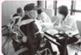
受入れ時、看護師が体調や服薬の確認を行いました。