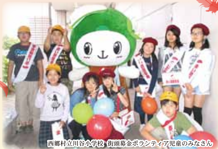
西郷村立川谷小学校 街頭募金ボランティア児童のみなさん

平成29年10月1日(日)、イオン白河西郷店様のご協力のもと、街頭募金活動を行いました。 羽太小学校・川谷小学校のボランティア協力児童が元気いっぱい募金を呼びかけ、三ッゴローも応援に駆けつけました。 西郷村共同募金委員会では、未来を担う子供たちに「支え合い」を身近に感じ体験していただきたいと考え、毎年村内の小学生と一緒に街頭募金活動を行っています。