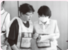
指定避難所で受入れ困難な方を、福祉避難所で受け入れる訓練。指定避難所の保健師から、福祉避難所の看護師が引継を受けています。