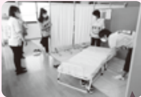
座位がとれない方の受入れのため、ベッドを設置しています。

災害発生時に障がい者や高齢者、妊産婦や乳幼児、難病患者とその家族らのうち、一般の避難所生活が困難で特別な配慮が必要な人を受け入れる、二次的な避難所です。まずは配慮が必要な人も一般避難所で生活し、その後、自治体側が対象者を選びます。