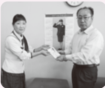
郡山ヤクルト販売 様