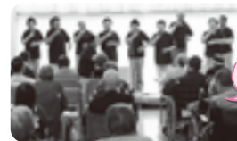
手話をしながら合唱

今年は23人の会員が参加し、歌やおどり、ハーモニカ演奏を披露し、楽しいひと時をともに過ごしました。