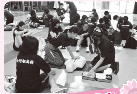
救命法講習のようす