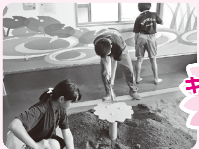
キッズランド はしごう