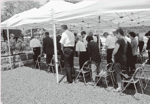
二二八柱の英霊に黙とうを捧げました

八月十五日 第七十回 目の終戦記念日に西郷村 遺族会主催による「英霊の 碑」参拝が行われました。 戦没者ご遺族をはじめ ご来賓の皆様方をお迎え し、全国戦没者追悼式の ラジオ放送に合わせ正午 に黙とうを行いました。 ご参列いただきました 約四十名の方々にご焼香 いただき、先の大戦にお いて亡くなられた方々の ご冥福をお祈りするととも に、戦後七十年という節目 にあたり、わが国の平和を より一層願う日となりま した。